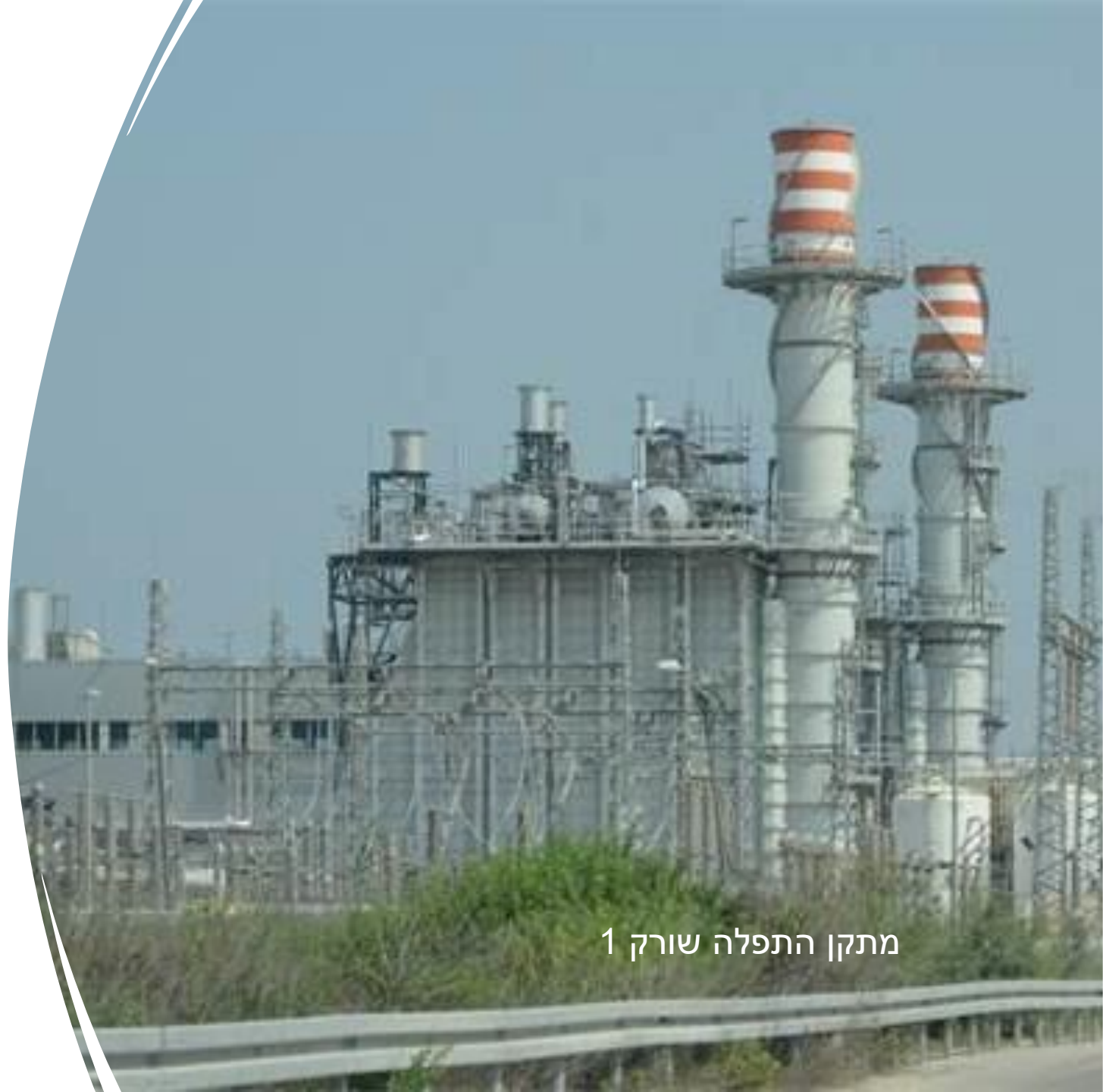
מתקן התפלה שורק 1